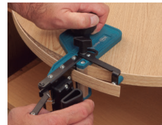
Das Schneiden des Überstandes bei runden Platten.