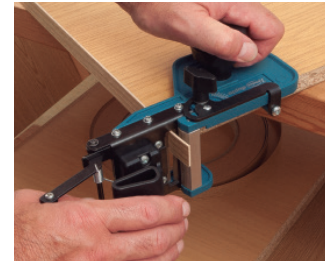
Das Schneiden an beiden Enden der geraden Platte.