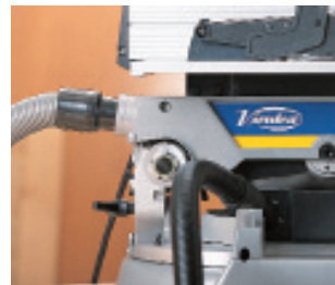
Selbstöffnende und selbstschließende Schutzhaube.