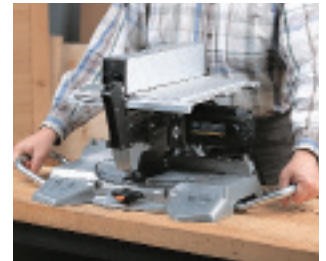
Sonderzubehör: Seitliche Tragegriffe (Art. 3345470).