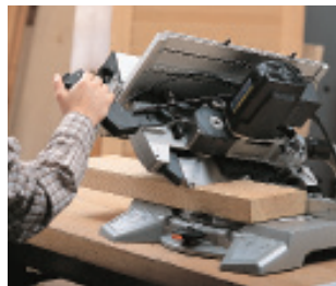
Solider Arbeitstisch mit großer Auflagefläche.