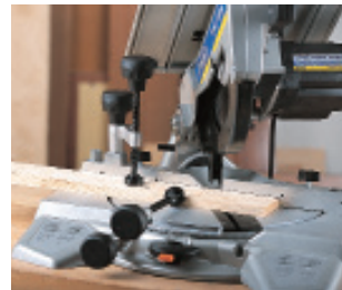
Sonderzubehör: Spannbacken-Set (Art. 3345416).