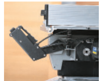
Ergonomischer, verstellbarer Griff.