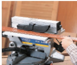
Oberer Tisch mit Längsanschlag und Spaltkeil. Sägeblattschutz für gefahrloses Arbeiten.

3345416 Spannbacken-Set 3345470 Seitliche Tragegriffe 7246098 Gehrungsanschlag 6446073 Absaug Schlauch, 2,25 m 5800100 Fahrbarer Arbeitstisch