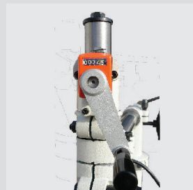
Höhenverstellung von vorne.