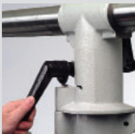
Komfortstativ mit Memolock.