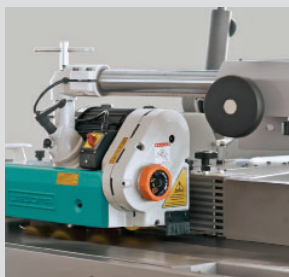
Variomatic mit Anbausatz für Maschinen mit Support.