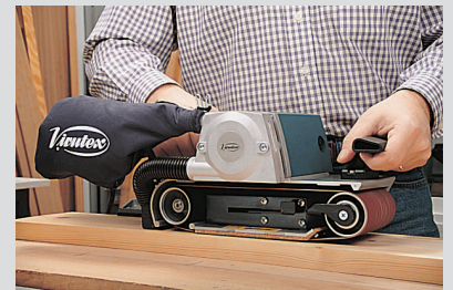
LB31EA mit Staubsack.