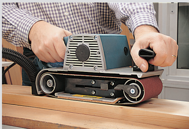
Große Schleiffläche für gleichmäßiges Schleifen ohne Riefen.